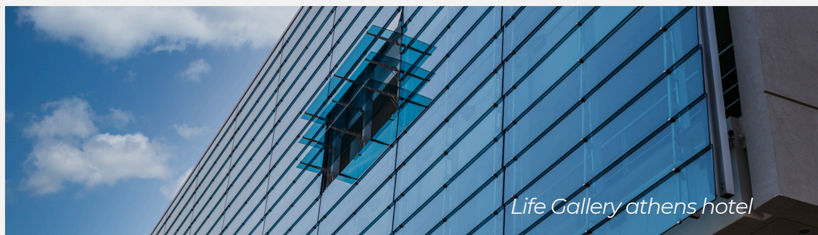
Life Gallery athens hotel