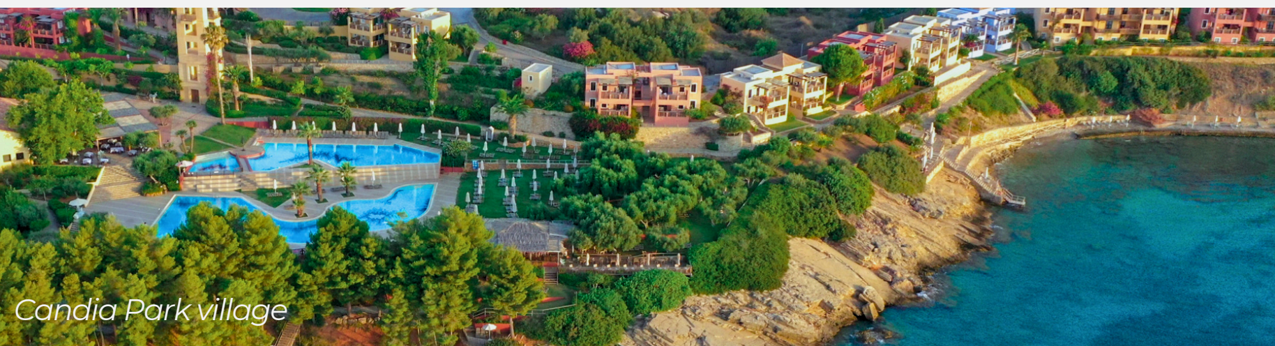
Candia Park village