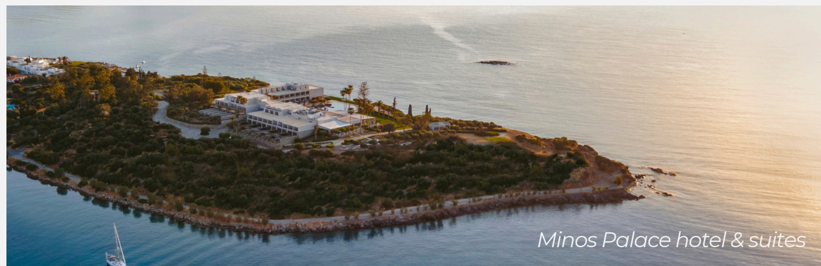
Minos Palace hotel & suites