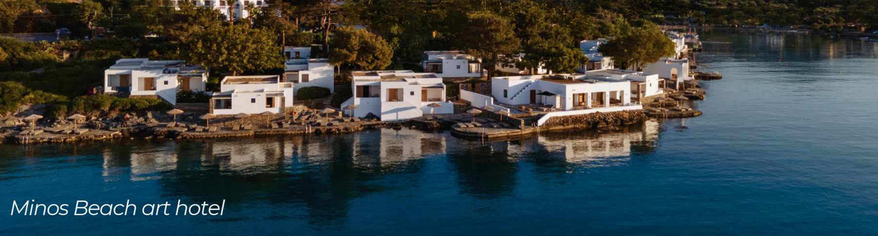
Minos Beach art hotel