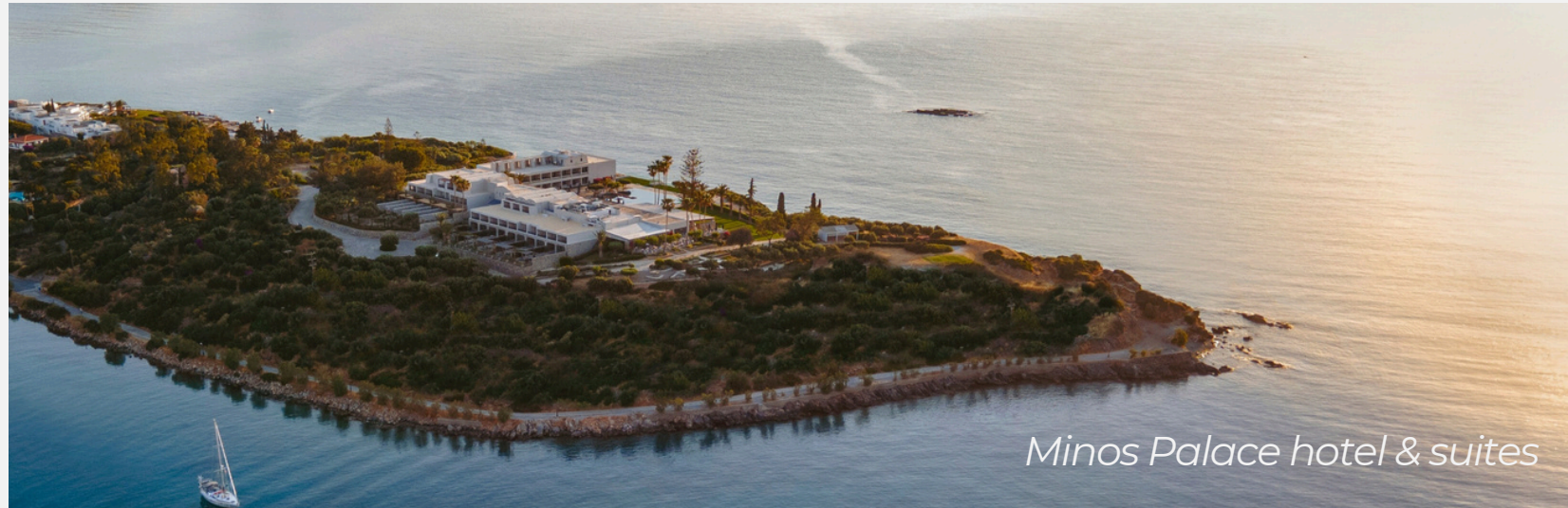
Minos Palace hotel & suites