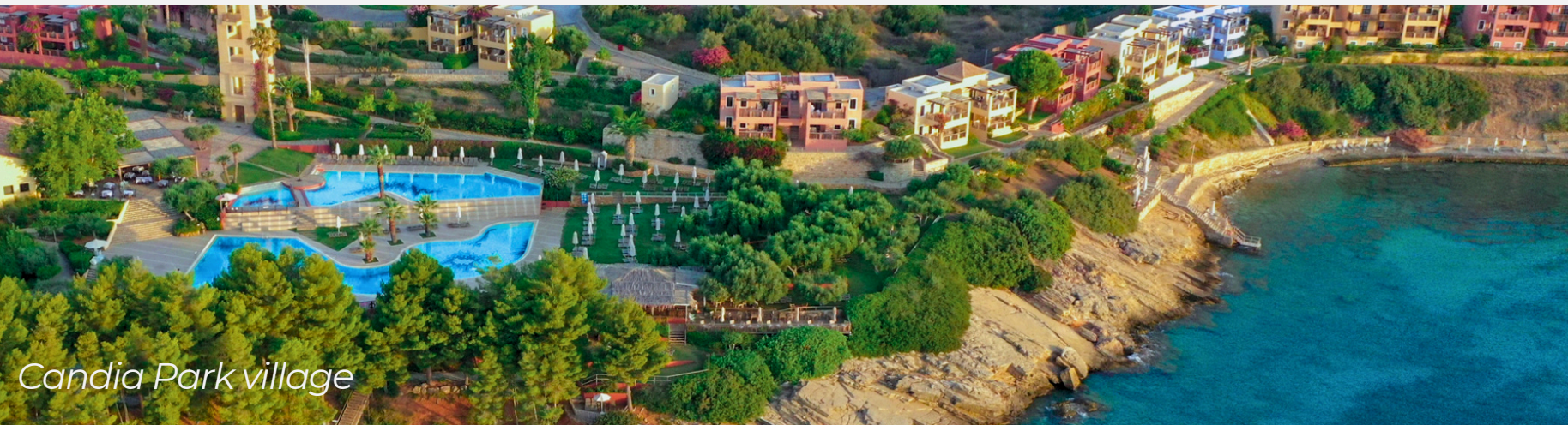
Candia Park village