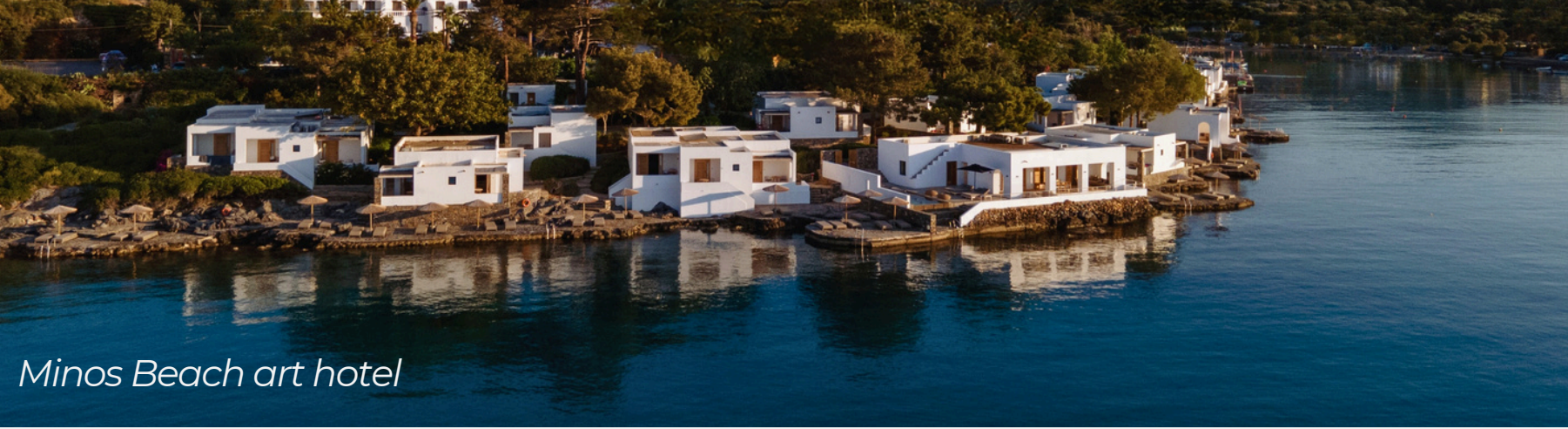
Minos Beach art hotel